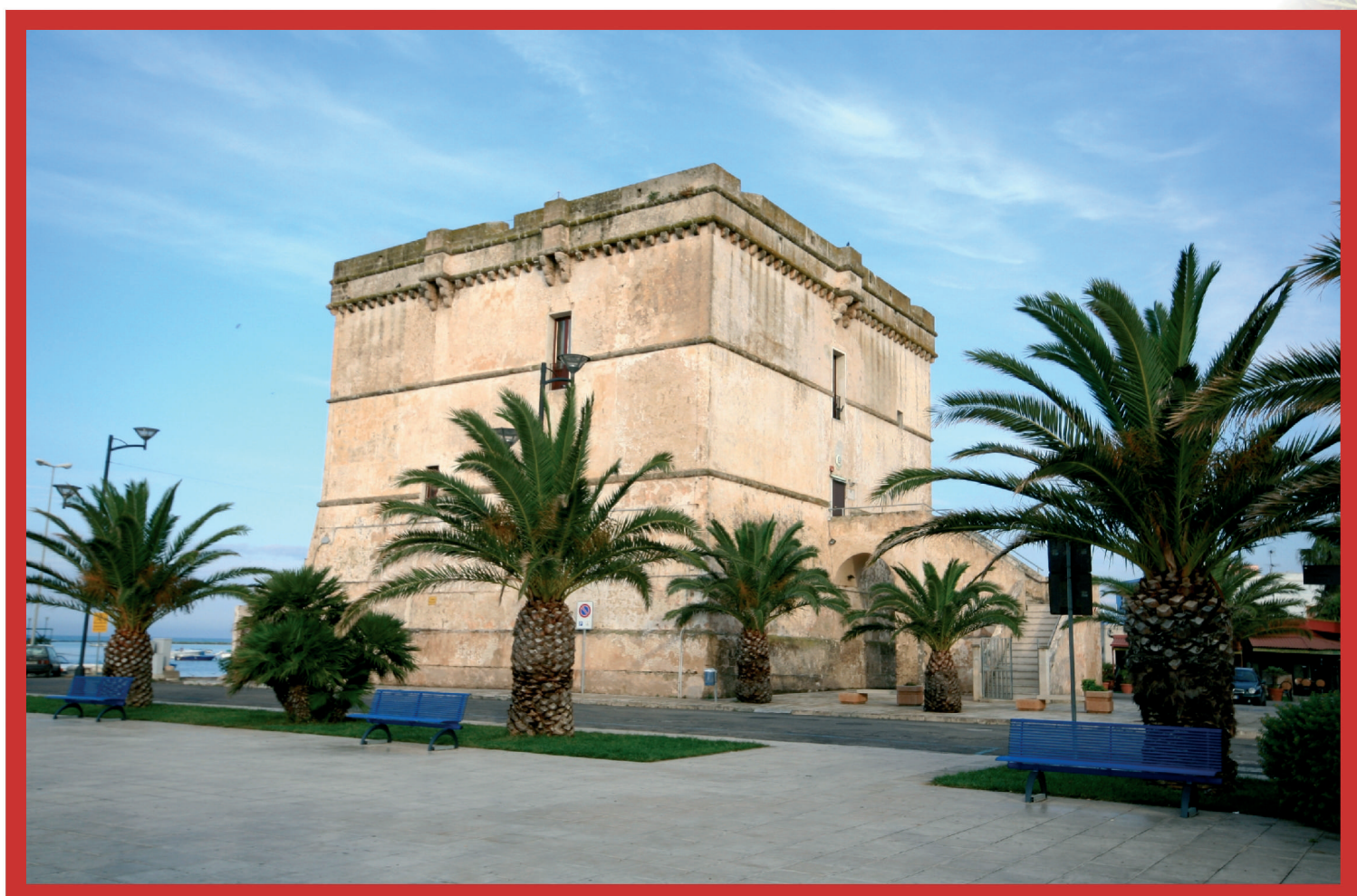
"Caesarae Augustae Civitas Sasinae Arneique Portus" Torre Capitanica sede di Sopraguardia della Comarca di Cesarèa

PORTO CESAREO dal 18 luglio al 4 agosto 2008