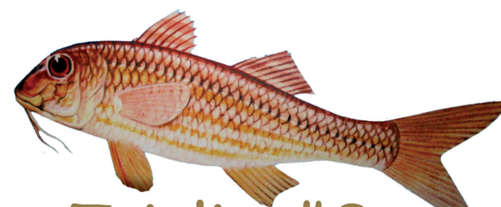
La Triglia d'Oro